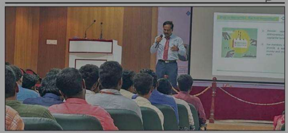
மணக்குள விநாயகர் கலை-அறிவியல் கல்லூரியில்