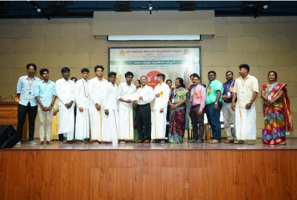
(வணிகவியல் துறை மாணவர்கள் பரிசு பெறும் காட்சி)