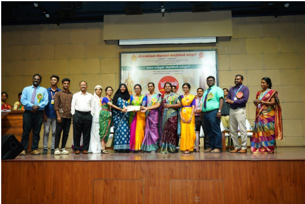
(கணினி அறிவியல் துறை மாணவர்கள் பரிசு பெறும் காட்சி)