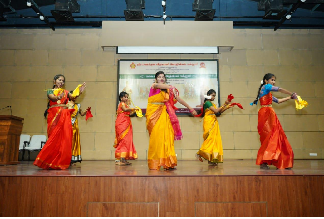
(தமிழரின் பாரம்பரிய கிராமிய நடனம்)