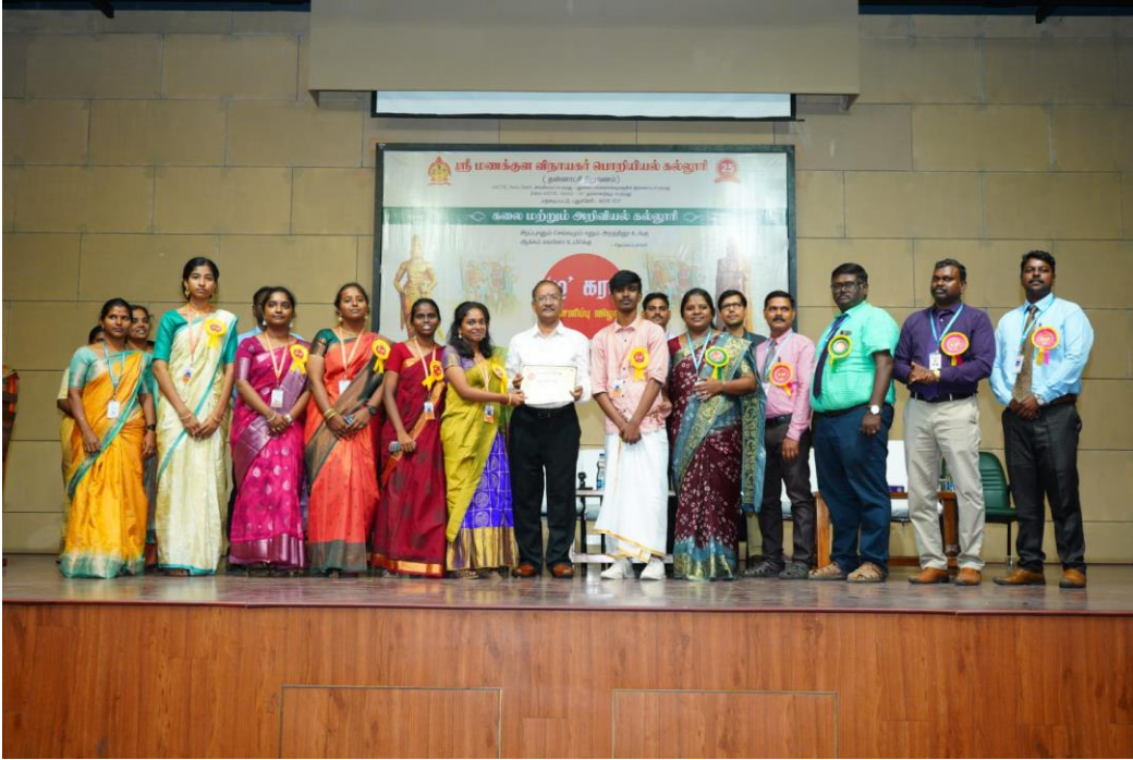
(வணிக மேலாண்மை துறை மாணவர்கள் பரிசு பெறும் காட்சி)