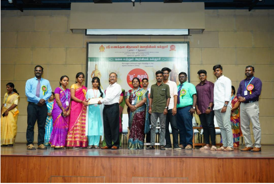
(வணிகவியல் துறை மாணவர்கள் பரிசு பெறும் காட்சி)