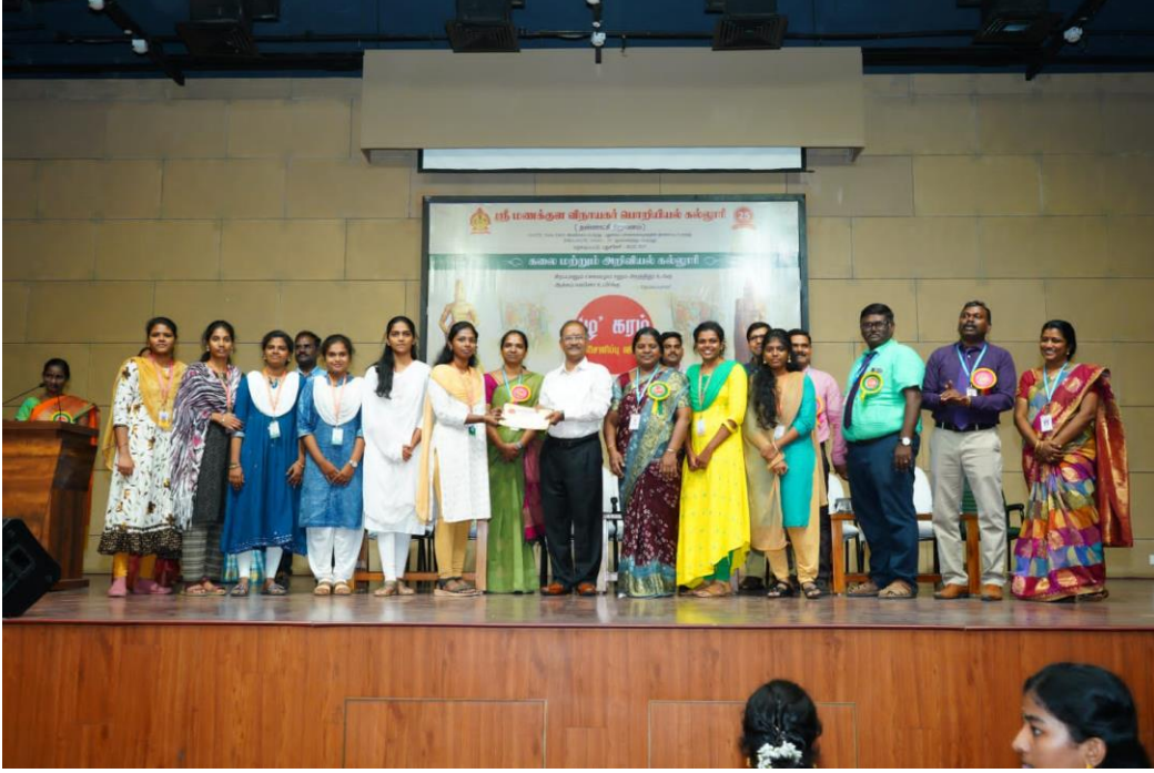
(வணிகவியல் துறை மாணவர்கள் பரிசு பெறும் காட்சி)