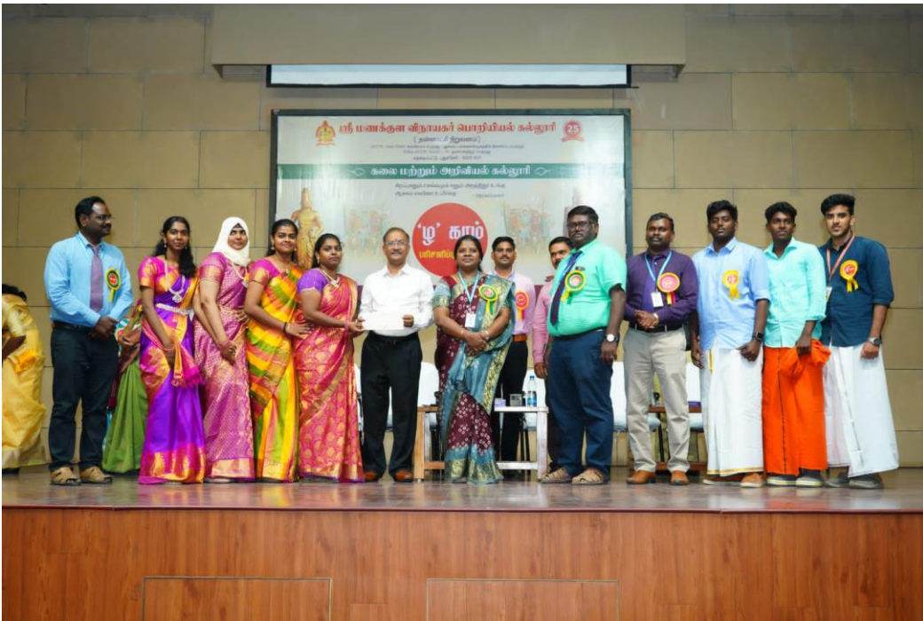
(கணினி அறிவியல் துறை மாணவர்கள் பரிசு பெறும் காட்சி)