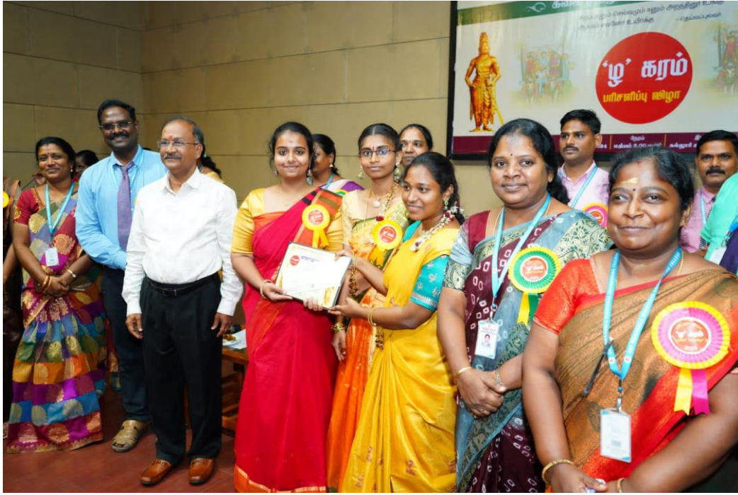
(உணவு மற்றும் ஊட்டச்சத்து துறை மாணவர்கள் பரிசு பெறும் காட்சி)