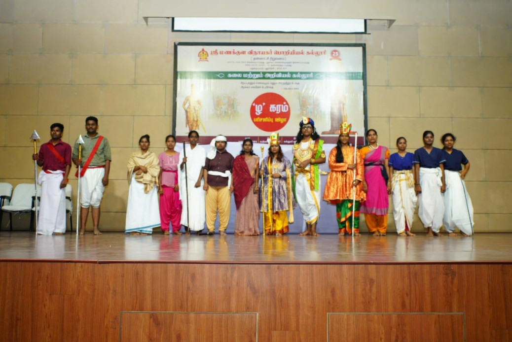
(பழந்தமிழர் இலக்கிய நாடகம் அரங்கேறிய காட்சி)