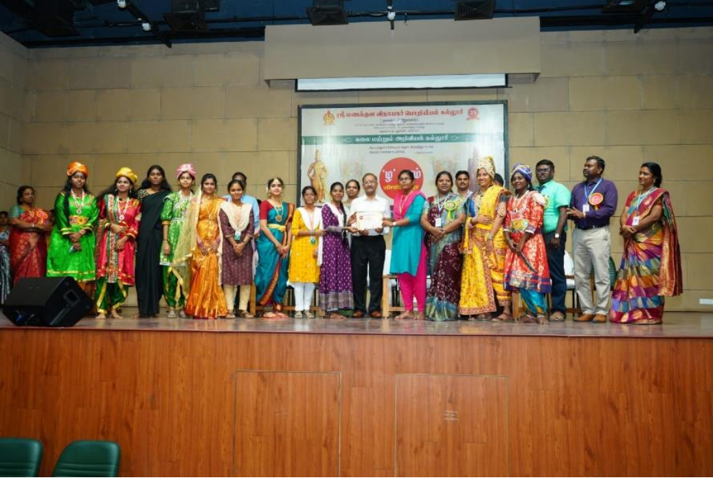
(வணிகவியல் துறை மாணவர்கள் பரிசு பெறும் காட்சி)